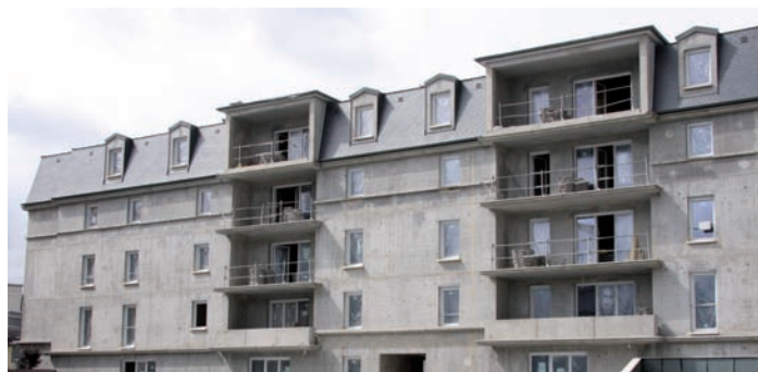
Thermovoil d'Unibéton répond aux règles traditionnelles de mise en œuvre et évite la pose de rupteurs de ponts thermiques.

Au-delà des ses performances élevées, Thermovoil s'avère parfaitement conforme à la norme NF EN 206-1 et au NF DTU 21 (édition 2013) ainsi qu'aux réglementations sismique et acoustique en vigueur.