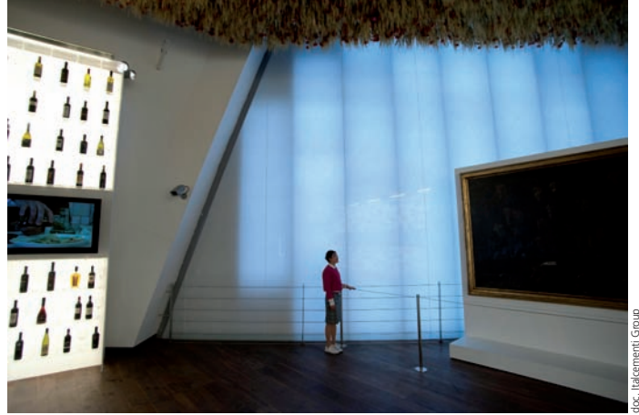
Panneau de béton prêt à l'emploi, i.light laisse passer la lumière naturelle ou artificielle, grâce à un savant mélange d'une matrice cimentaire haute technologie et de résines spéciales.