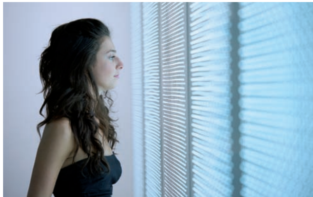
Paroi intérieure en i.light.